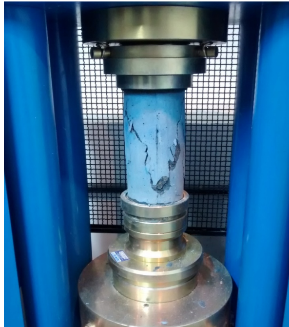
Figura 1 – Ensaio de compressão de traço contendo pigmento azul