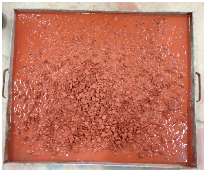
Figura 2 – Concreto fresco vermelho de 2ª geração com elevado valor de fluidez

Como resultado, o abatimento apresentado foi de 26 cm, valor extremamente elevado. Apesar disso, o resultado do ensaio de compressão aos 14 dias foi de 53,9 MPa, muito superior aos 40,7 Mpa alcançado pelo concreto vermelho de 1ª geração.