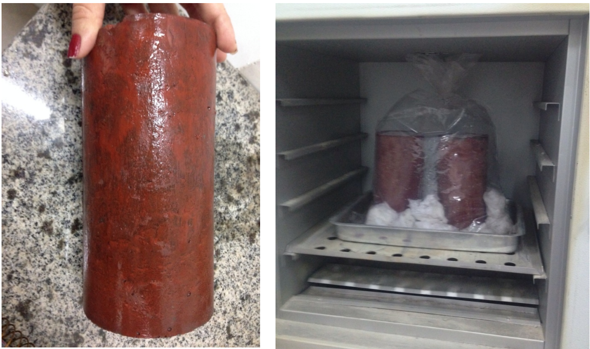
Figura 3 – Concreto vermelho de 3ª Geração: a) após a desmoldagem, apresentando coloração vermelha mais intensa, b) corpos de prova sendo curados em estufa a 50°C com elevado teor de umidade.

Já o concreto vermelho de 3ª geração teve o traço de 1 : 0,75 : 0,5 : 2,1 (cimento:areia:brita0:brita1). Em função da massa do cimento, foi utilizado 0,7% de aditivo superplastificante e 8% de pigmento, e teor a/c 0,25. Novamente, o objetivo foi reduzir o teor de água, entretanto, usando valor intermediário de aditivo. Para este traço, foram usadas duas formas de cura: corpo de prova imerso em água a temperatura ambiente e corpo de prova em estufa a 50°C, com elevado teor de umidade (Figura 3).