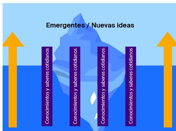
Figura 1 – Representación de un islote de racionalidad – elaboración propia.

Se usa la palabra “islote” porque usa la metáfora de un islote que emerge en un océano y hace referencia a la posibilidad de construcción de una inteligibilidad en un océano de desconocimiento (Bahamonde, 2007), y también a la idea de que no son necesarios “los continentes disciplinares” para su desarrollo, sino aquellos aspectos de los modelos de racionalidad de las disciplinas que colaboren en hacer inteligible un fenómeno complejo. Dicha metáfora de los islotes de racionalidad se concreta en la imagen presentada en la siguiente figura.