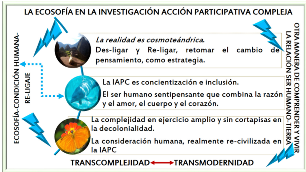
Figura 2 realizada para la investigación 2020