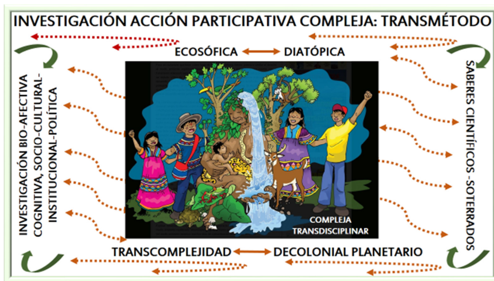
Figura 4 realizada para la investigación 2020

En lo que sigue se presenta un gráfico que intenta, aun cuando no lo logra resumir la esencia de la IAPC como transmétodo.